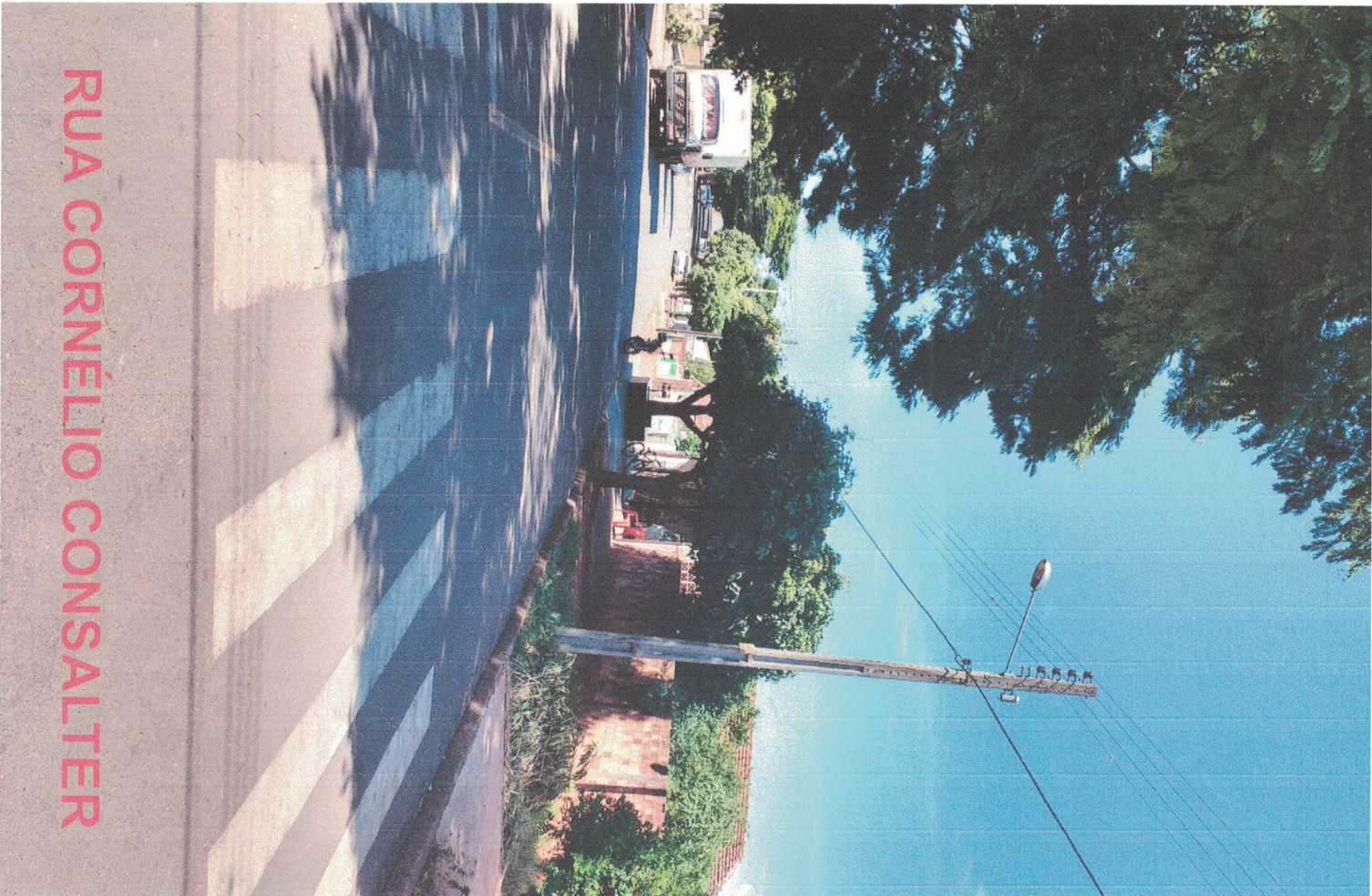
RUA CORNÉLIO CONSALTER