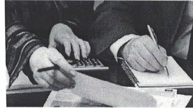
Controle Interno O Encerramento do Exercício

Faça o curso acima e ganhe 50% de desconto no valor da matrícula deste curso =====>